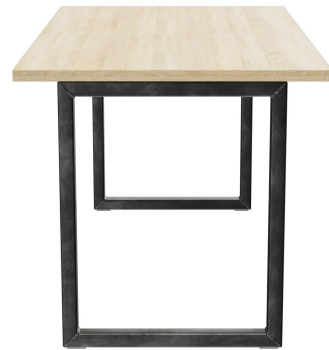
TABLE À MANGER RICKON