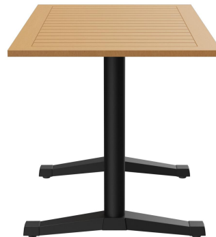
TABLE À MANGER KATA