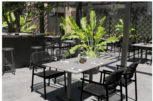
TABLE À MANGER KATA