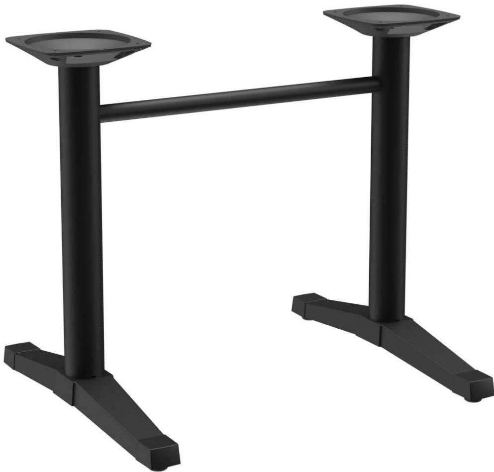
TABLE À MANGER KATA