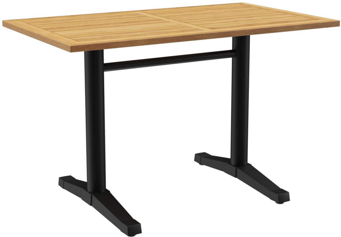
TABLE À MANGER KATA