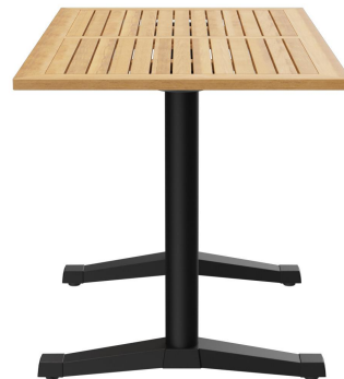
TABLE À MANGER KATA