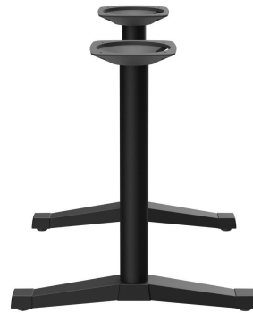
TABLE À MANGER KATA