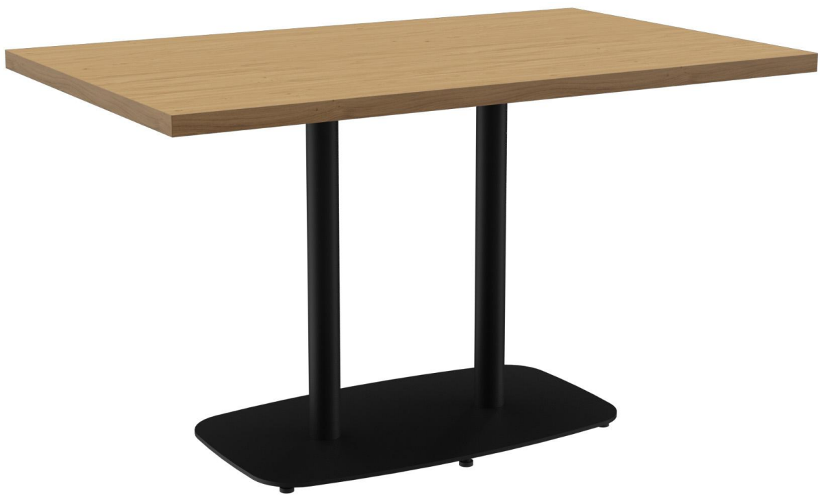
TABLE À MANGER VISAR