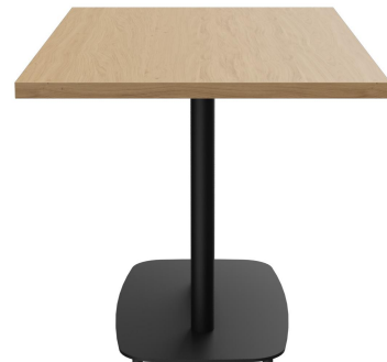
TABLE À MANGER VISAR