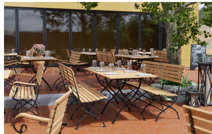
TABLE À MANGER VALENTIN T