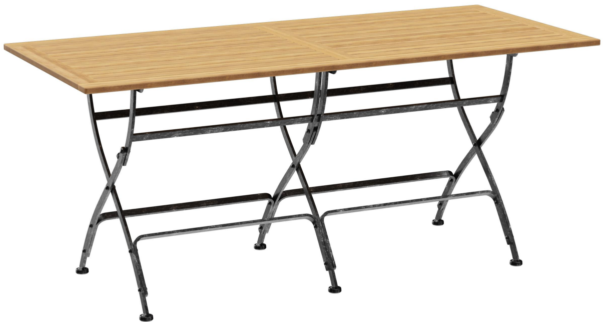
TABLE À MANGER VALENTIN T