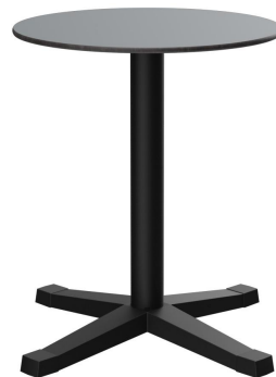
TABLE À MANGER KATA