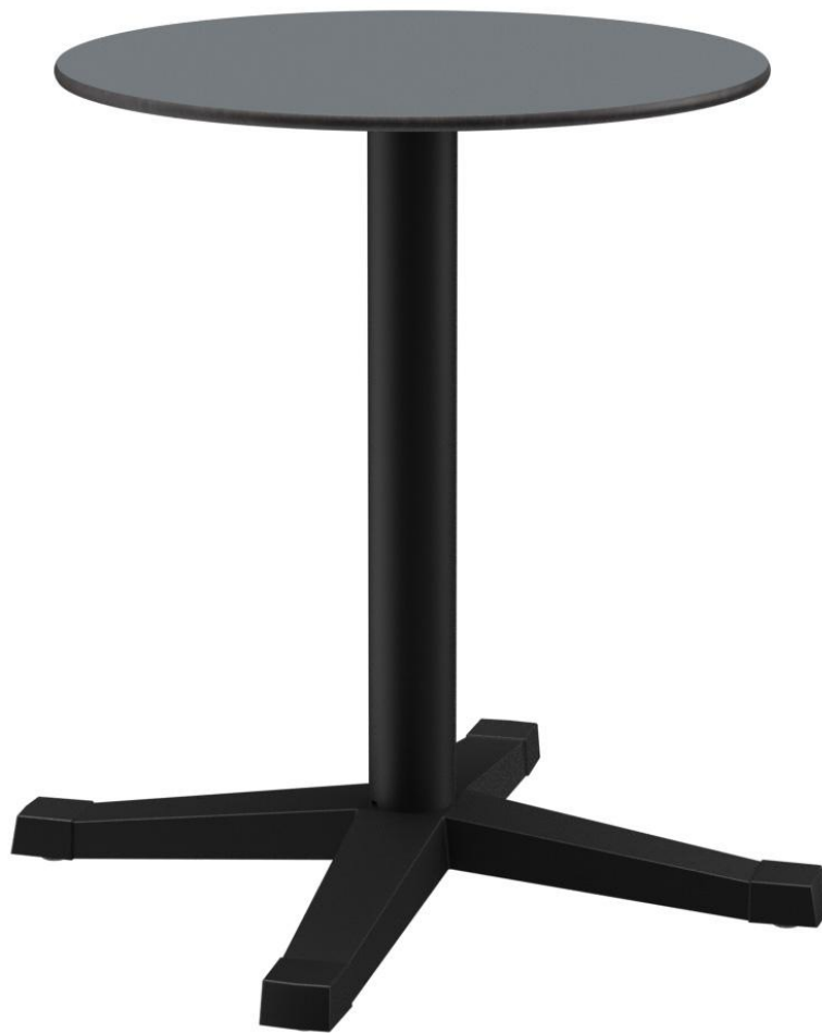
TABLE À MANGER KATA