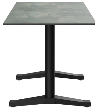
TABLE À MANGER KATA