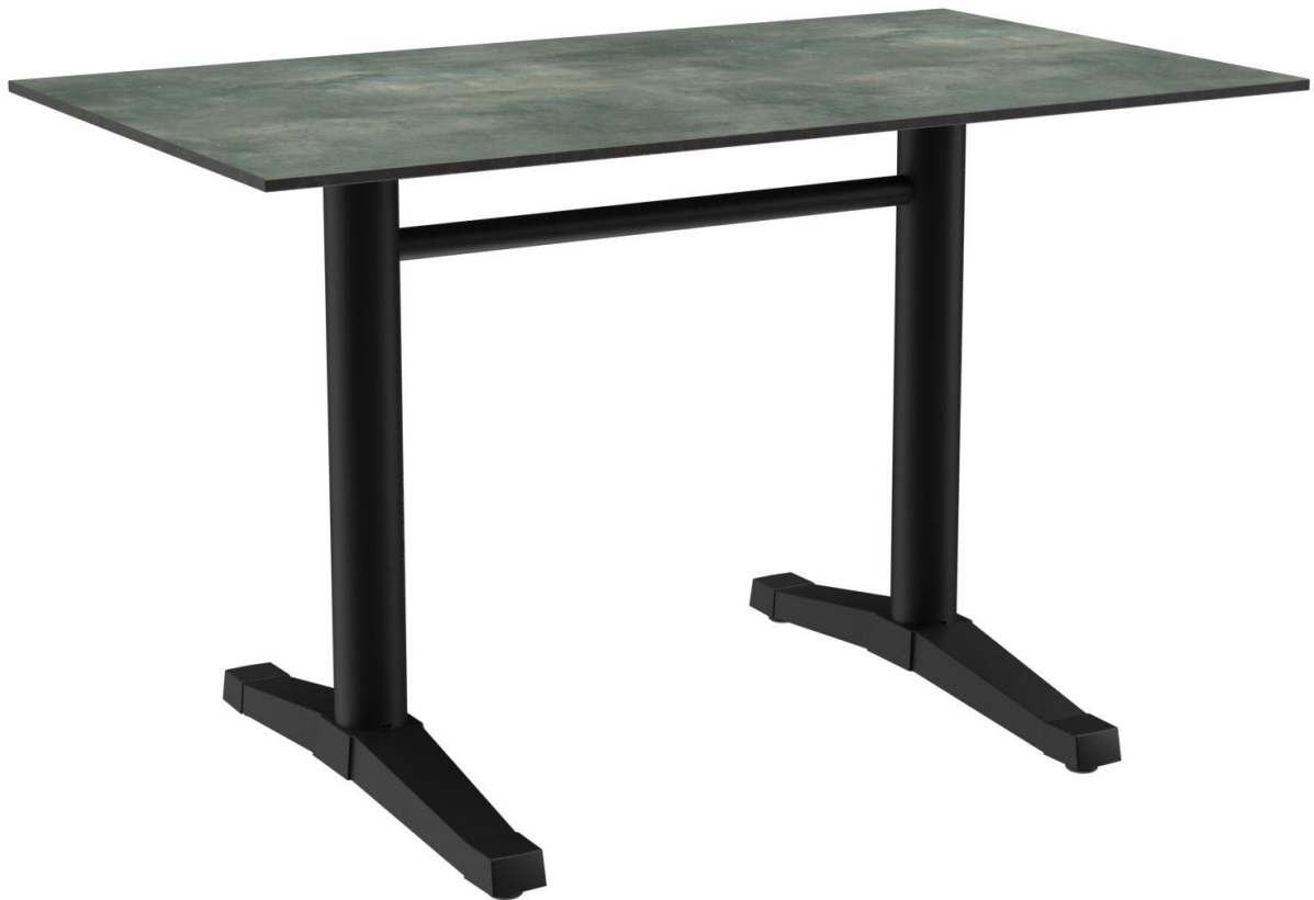
TABLE À MANGER KATA