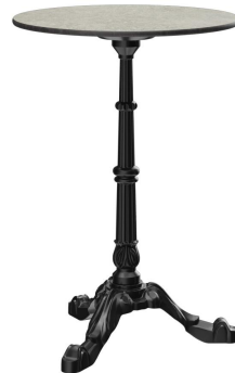
TABLE À MANGER VERMA