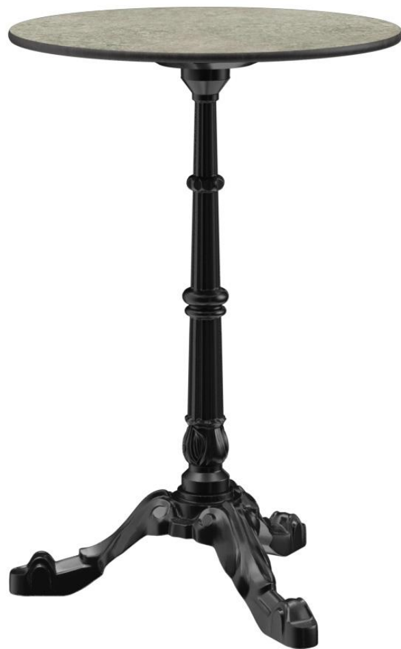
TABLE À MANGER VERMA