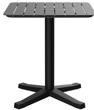
TABLE À MANGER KATA