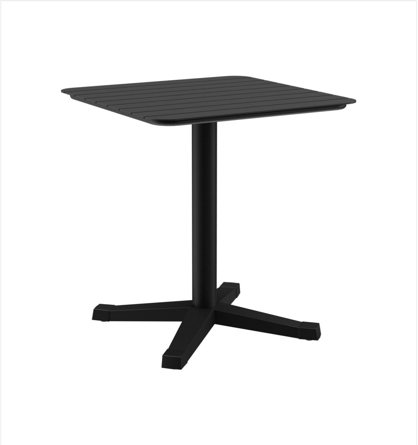
TABLE À MANGER KATA