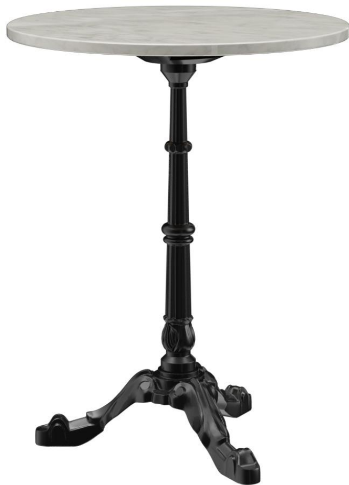
TABLE À MANGER VERMA