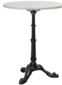
TABLE À MANGER VERMA