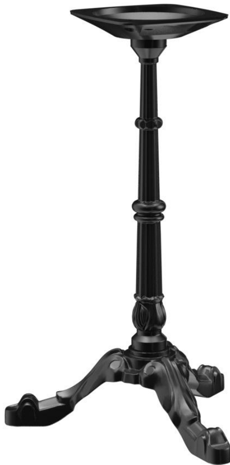
TABLE À MANGER VERMA