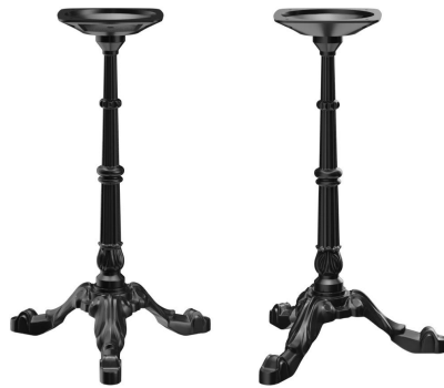
TABLE À MANGER VERMA