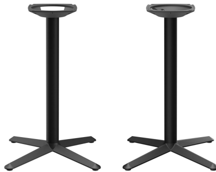
TABLE À MANGER KERNO