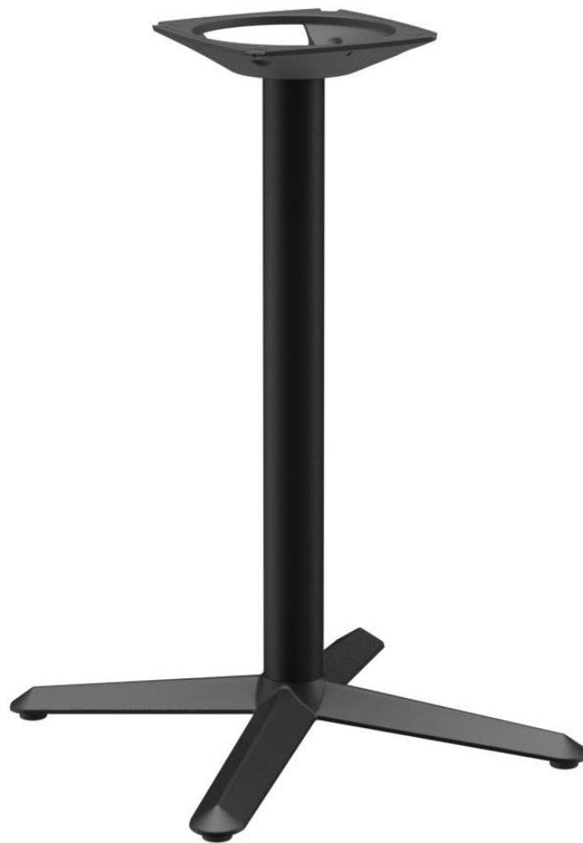
TABLE À MANGER KERNO